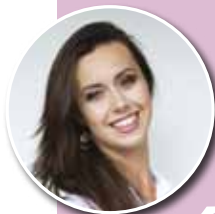
Zuzanna Leszczyńska Redaktor wydania

Ślub to jedno z najważniejszych wydarzeń w życiu człowieka. By ten dzień był naprawdę wyjątkowy, warto zatroszczyć się o każdy szczegół. Dzięki temu można uniknąć niepotrzebnego stresu, a sama ceremonia może być spełnieniem naszych marzeń. Oddajemy w Państwa ręce Trendy Ślubne - produkt stworzony specjalnie z myślą o Państwie. Znajdziecie w nim informacje o najnowszych trendach, porady, a także kontakt do jubilerów, sal weselnych, wizażystek czy salonów mody.