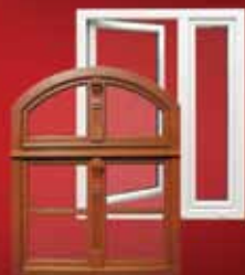
OKNA DREWNIANE I PCV

19-335 Prostki, ul. Rzemieślnicza 10, tel. kom. 605-328-067, tel./fax 87 611-20-69 e-mail: biuro@drzwi-karwowski.com.pl