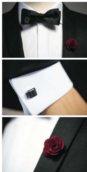
Брючный мужской костюм SPECIAL | Рубашка ARES | Заколка зажим для бутоньерки | Запонка для рубашек | Чёрная узкая бабочка | Белый мужской нагрудный платок