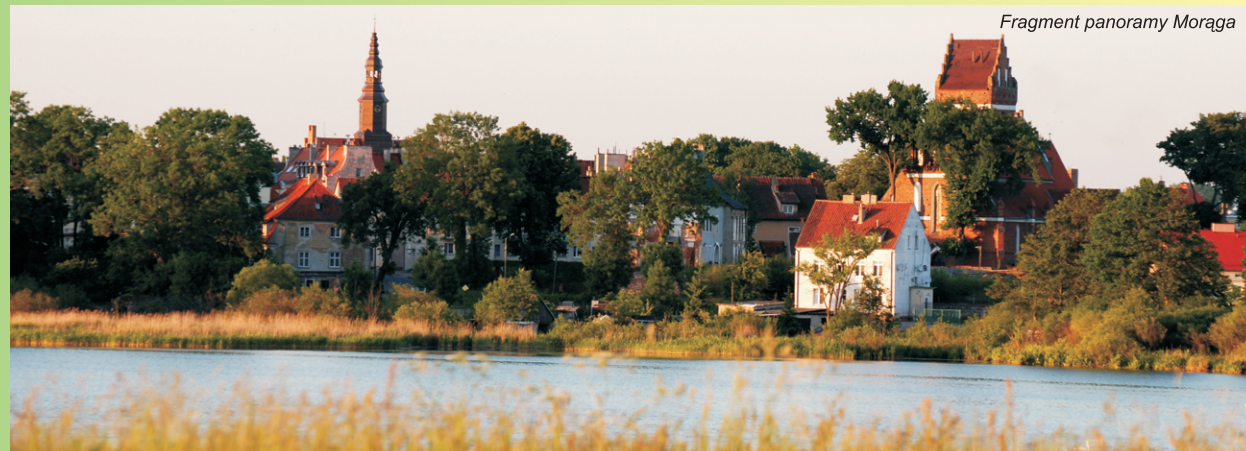
Fragment panoramy Morąga

Dodatkowe informacje: Teren idealny do zainwestowania przez dewelopera z uwagi na przeznaczenie terenu. Pożądane budownictwo wielorodzinne celem połączenia osiedla Sienkiewicza z Osiedlem Kolonia Warszawska. W bliskim sąsiedztwie planowana jest budowa wielofunkcyjnej pływalni w Morągu oraz budowa ulicy Kardynała Wyszyńskiego zapewniającej jeszcze lepszą dostępność komunikacyjną. Uprawy, nasadzenia, altany oraz inne urządzenia i elementy urządzenia terenu przeznaczone są do likwidacji w ramach przygotowania terenu pod inwestycje zgodne z przeznaczeniem w mpzp.