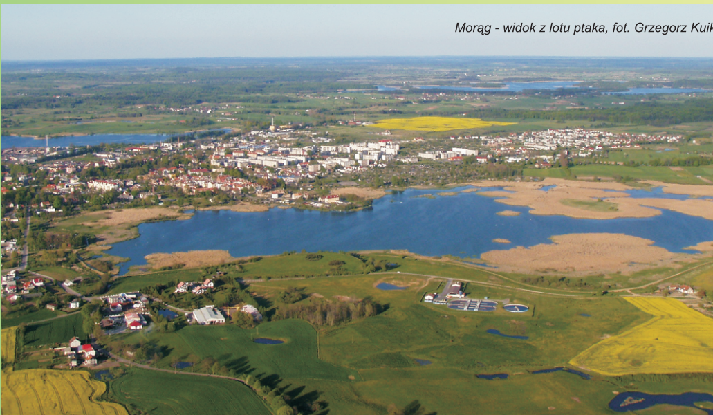
Morąg - widok z lotu ptaka

1. Teren niezabudowany położony w Gminie Morąg – Działki Nr 4/2 i 573 obręb Nr 3 Morąg Powierzchnia terenu: teren o powierzchni 2.2104 ha. Lokalizacja: nieruchomość usytuowana jest przy ulicy Przemysłowej w Morągu (część przemysłowa miasta w sąsiedztwie jeziora Skiertąg), nieruchomość od strony zachodniej znajduje się w sąsiedztwie miejskiej ciepłowni, od południowej graniczy z nieruchomością zabudowaną po byłej centrali nasiennej (ostatnio mieścił się tam zakład produkcji opakowań z drewna, w chwili obecnej nieużytkowana) stanowiąca własność osoby fizycznej, a od strony wschodniej z