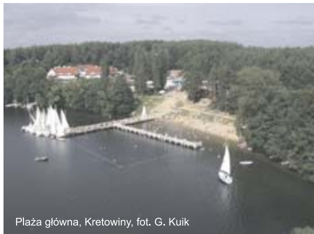
Plaża główna, Kretowiny

9. Rozlewisko morąskie, o powierzchni 121,7 ha,