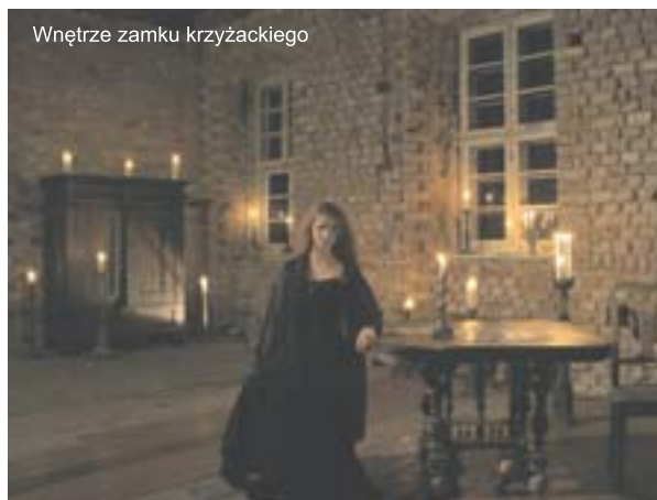
Wnętrze zamku krzyżackiego

13. Pomnik i cmentarz Poległych Żołnierzy Armii Radzieckiej, postawiony na miejscu dawnego kościoła katolickiego, rozebranego po wojnie.