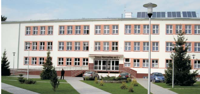
Wyremontowana Szkoła Podstawowa Nr 4 w Morągu

Gimnazjum w Żabim Rogu od 2009 r. realizuje we współpracy z Uniwersytetem Gdańskim i Uniwersytetem Warmińsko-Mazurskim projekt finansowany z Europejskiego Funduszu Społecznego „Za rękę z Einsteinem”. Projekt jest ukierunkowany na wyrównywanie szans edukacyjnych, rozwijanie aspiracji edukacyjnych, społecznych i życiowych uczniów pochodzących z obszarów wiejskich. Dzięki projektowi uczniowie mogą rozwijać swoją wiedzę i umiejętności z matematyki, chemii, fizyki, j. angielskiego. Jest to projekt trzyletni, realizowany będzie do końca 2011.