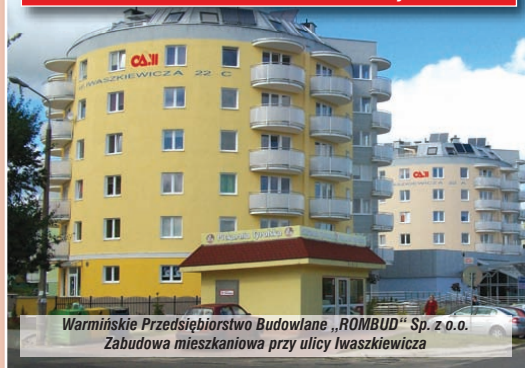
Warmińskie Przedsiębiorstwo Budowlane „ROMBUD” Sp. z o.o. Zabudowa mieszkaniowa przy ulicy Iwaszkiewicza