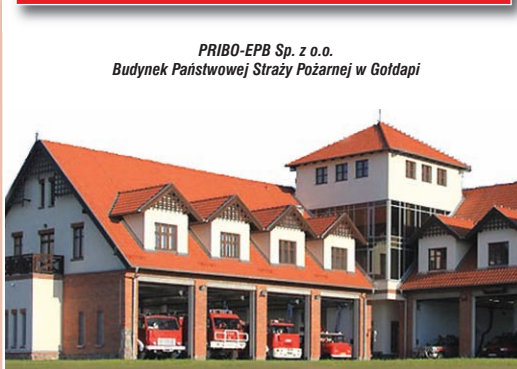
PRIBO-EPB Sp. z o.o. Budynek Państwowej Straży Pożarnej w Gołdapi