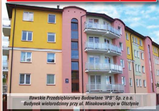
Itawskie Przedsiębiorstwo Budowlane „IPB” Sp. z o.o. Budynek wielorodzinny przy ul. Minakowskiego w Olsztynie