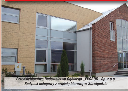
Przedsiębiorstwo Budownictwa Ogólnego „EKOBUD” Sp. z o.o. Budynek usługowy z częścią biurową w Stawigudzie