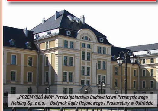
„PRZEMYSŁÓWKA” Przedsiębiorstwo Budownictwa Przemysłowego Holding Sp. z o.o. – Budynek Sądu Rejonowego i Prokuratury w Ostródzie