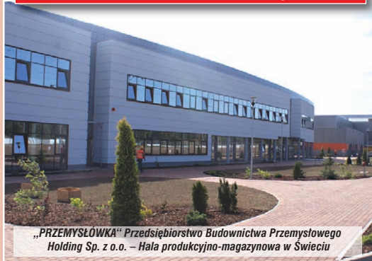
„PRZEMYSŁÓWKA” Przedsiębiorstwo Budownictwa Przemysłowego Holding Sp. z o.o. – Hala produkcyjno-magazynowa w Świeciu