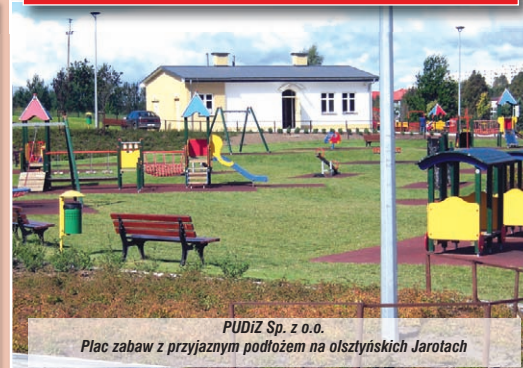
PUDIZ Sp. z o.o. Plac zabaw z przyjaznym podłożem na olsztyńskich Jarotach