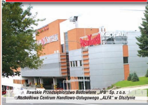
Itawskie Przedsiębiorstwo Budowlane „IPB” Sp. z o.o. Rozbudowa Centrum Handlowo-Usługowego „ALFA” w Olsztynie