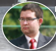
Dominik Tarnowski Starosta