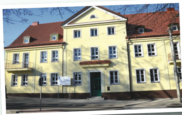
Zespół Szkół Nr 1 w Białej Piskiej

oraz Oddziału Intensywnej Terapii, co pozwoli przywrócić zlikwidowany w roku ubiegłym oddział ratunkowy.