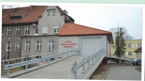
Szpitalny Oddział Ratunkowy w Pisz

Działania te wraz z podjętymi przez SP ZOZ Szpital Powiatowy w Pisz pracami wewnątrz ocieplonego budynku dały nie tylko estetyczny wygląd, ale także funkcjonalność oraz nowoczesne sale przeznaczone dla najmłodszych pacjentów. Obok powyższych zmian SP ZOZ wraz ze wsparciem finansowym Powiatu Piskiego w kwocie 4,5 mln zł przeprowadził także gruntowną modernizację Szpitalnego Oddziału Ratunkowego