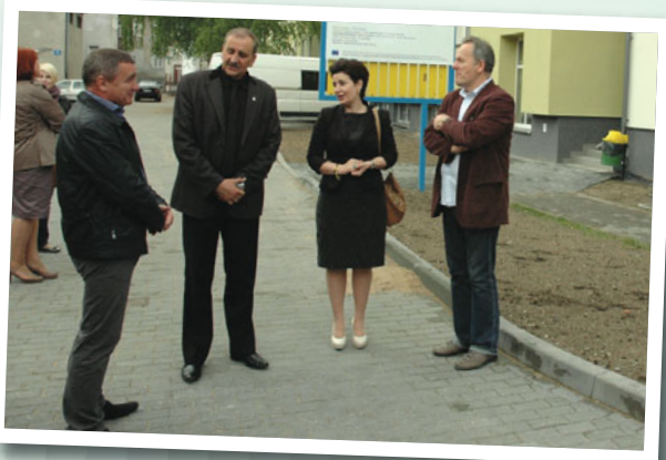
SP ZOZ Szpitala Powiatowego w Pisz

W tym momencie realizacji budżetu widać już jasno, co udało się zrobić w bieżącym roku. Zdaję sobie sprawę z potrzeb, jakie istnieją na terenie Powiatu Piskiego i z tego, że szkoły, drogi oraz budynki użyteczności publicznej wymagają dodatkowego finansowania. Jednak skalą sukcesu jest to, co udało się zrealizować oraz zaplanować do zrealizowania na kolejny rok. Cierpliwość, przemyślane planowanie oraz umiejętność rozgraniczania potrzeb przynosi oczekiwane efekty, które są widoczne w zmianach, jakie zachodzą w naszym otoczeniu.