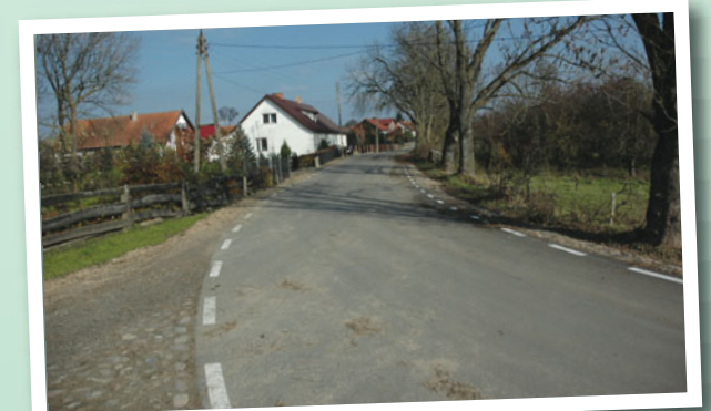
Droga powiatowa Nr 1700 N (miejscowość Pianki).