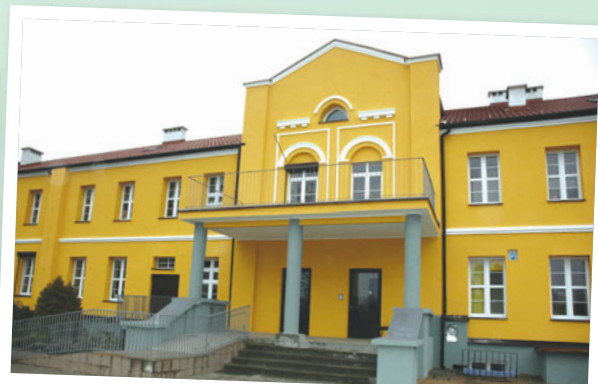
Specjalny Ośrodek Szkolno-Wychowawczy w Łupkach

Bieżący rok przyniósł także kontynuację rozpoczętych wcześniej projektów m.in. realizowane w Powiatowym Urzędzie pracy w Pisz: „Urząd z klasą”, „Bez barier”, „Postawmy na młodych” czy „Solidny starter zawodowy” oraz inaugurację programu „Mazurski wilk przedsiębiorczości” w Starostwie Powiatowym w Pisz. Budżet realizowanych aktualnie 8 projektów to ponad 14,2 mln zł. Jednak projekty współfinanso-