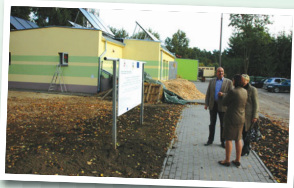
Kotłownia przy Zespole Szkół Leśnych w Rucianem Nidzie

oraz Oddziału Intensywnej Terapii, co pozwoli przywrócić zlikwidowany w roku ubiegłym oddział ratunkowy.