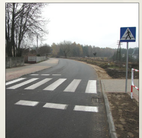
Droga w Lidzbarku przy ul. 3 Maja