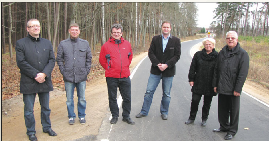
Odbiór drogi powiatowej Gronowo-Rybno

Przebudowa w istniejącym pasie drogowym, poprzez budowę chodnika przy drodze powiatowej nr 1591 N w miejscowości Purgalki o długości 184,00 m.b. Koszt realizacji: 31328,12 zł. w tym : - środki Powiatu Działdowskiego – 15664,06 zł - środki Gminy Iłowo-Osada – 15664,06 zł