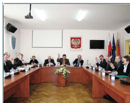
15-osobowa Rada Powiatu obraduje w odnowionej sali konferencyjnej z profesjonalnym sprzętem nagłaśniającym