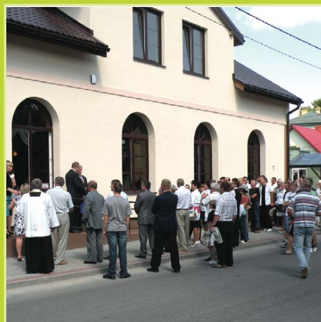
Otwarcie odbudowanego Gminnego Ośrodka Kultury w Wieliczkach