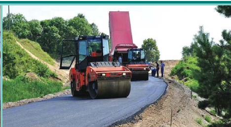
Budowa drogi powiatowej Krupin - Raczk Wielkie