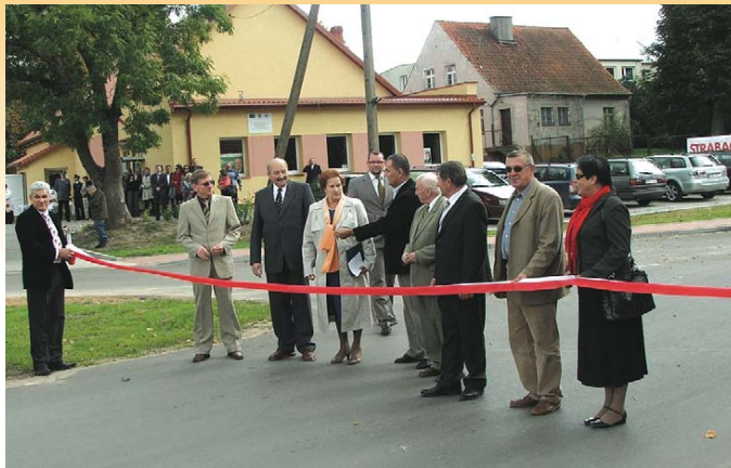
Uroczyste zakończenie przebudowy drogi powiatowej Kowale Oleckie - Sokółki - Dunajek o łącznej długości 8,39 km