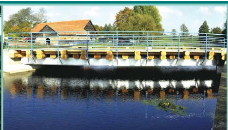
Most w Starostach po przebudowie