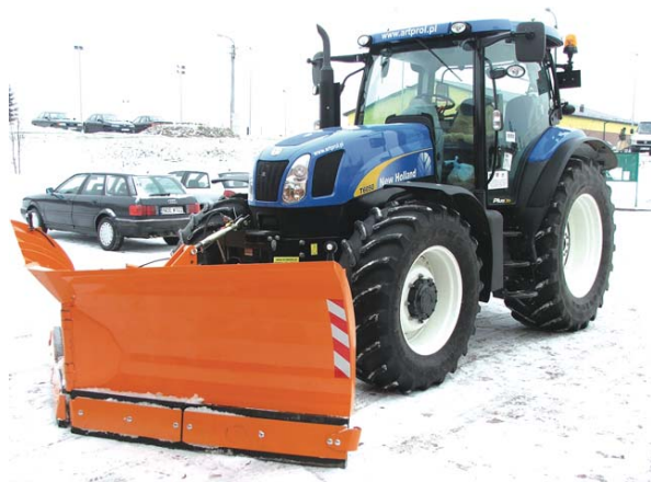
Dostawa sprzętu do równania i zimowego utrzymania dróg