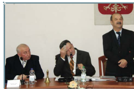
Podczas sesji płynnie czasami pot z czoła ...