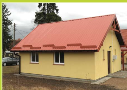
Świetlica wiejska w Niedźwiedzich