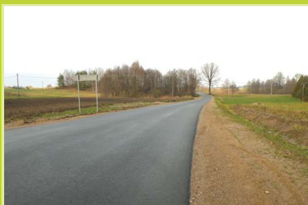
Droga Krupin - Raczk