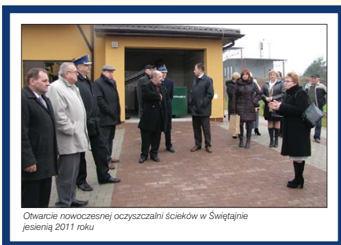
Otwarcie nowoczesnej oczyszczalni ścieków w Świętajnie jesienią 2011 roku

W celu likwidacji awaryjności na kolektorze sanitarnym w miejscowości Polom wykonany został remont kolejnej przepompowni ścieków za 53.013 zł. Natomiast remont budynku gminnego w Cichym kosztował 40.000 zł.