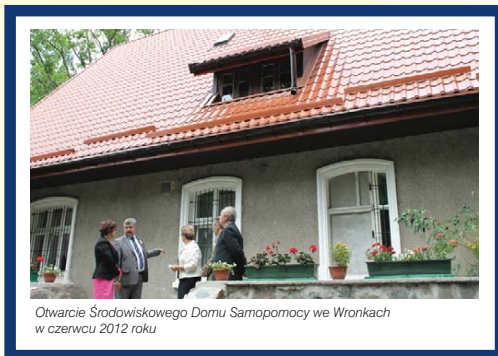
Otwarcie Środowiskowego Domu Samopomocy we Wronkach w czerwcu 2012 roku

Kolejnym bardzo dużym zadaniem zrealizowanym w 2012 roku była modernizacja budynku po zlikwidowanej w 2006 roku Szkole Podstawowej we Wronkach z adaptacją obiektu na Środowiskowy Dom Samopomocy, dzięki środkom finansowym pozyskanym od Wojewody Warmińsko-Mazurskiego. Wartość zadania zrealizowanego w latach 2011/2012 to - 1.190.820zł, w tym środki z dotacji Wojewody to - 1.069.038 zł. Placówka rozpoczęła działalność od 1.04.2012 r.