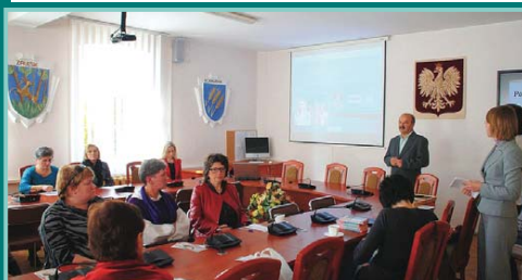
Spotkanie dot. profilaktyki raka piersi w Starostwie Powiatowym w Olecku

Rada i Zarząd Powiatu w Olecku składają podziękowania Gminom: Olecko, Kowale Oleckie, Świątajno i Wieliczki oraz Nadleśnictwom Olecko i Czerwony Dwór oraz Spółdzielni Mieszkaniowej w Olecku za współpracę przy realizacji zadań inwestycyjnych. Dziękujemy również jednostkom organizacyjnym powiatu za zaangażowanie i wkład pracy w realizację przedsięwzięć służących mieszkańcom. Uzyskane rezultaty były możliwe do osiągnięcia dzięki dobrej współpracy z instytucjami i podmiotami działającymi w naszym regionie.