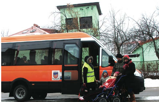
Zakup autobusu przystosowanego do przewozu osób niepełnosprawnych