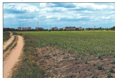
Teren w pobliżu drogi krajowej nr 58 wyróżniony tytułem „Grunt na medal”.

droga krajowa nr 58. Możliwość objęcia części nieruchomości Warmińsko-Mazurską Specjalną Strefą Ekonomiczną.