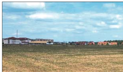
Teren inwestycyjny przy ul. Słubickiej.

Działka nr 1135 o pow. 0,81 ha. Teren przeznaczony pod obiekty produkcyjne, składy i magazyny, wszelką działalność gospodarczą z zakresu produkcji, składów, baz i magazynów oraz usług z wyłączeniem przedsięwzięć mogących znacząco oddziaływać na środowisko i obiektów stwarzających zagrożenia dla środowiska, życia i zdrowia ludzi. Dopuszcza się mieszkania integralnie związane z prowadzoną działalnością. Uzbrojenie: energia elektryczna, kanalizacja, dojazd drogą żwirową utwardzoną.