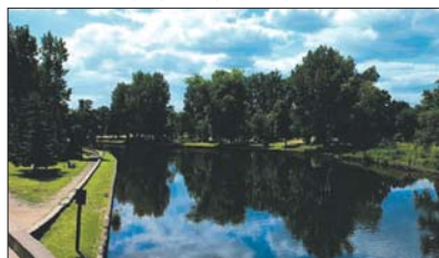
Plac Zamkowy położony jest nad rzeką Pisz.

Działki o pow. 2,8872 ha. Teren przeznaczony na cele usług turystycznych (obiekt hotelowy, hotelowo-mieszkalny, lokale usługowe i mieszkalne z funkcją towarzyszącą i uzupełniającą taką jak: gastronomia, odnowa biologiczna, rekreacja itp.). Ponadto przewiduje się lokalizację portu przystani wodnej z infrastrukturą i obiektami towarzyszącymi związanymi z obsługą usług sportowo-rekreacyjnych. Uzbrojenie: energia elektryczna, woda, kanalizacja, gaz, dojazd drogą bitumiczną.