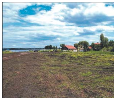
Teren inwestycyjny przy ul. Staszica w Pisz.

Część działki nr 120 o pow. około 1,00 ha. Przeznaczenie – teren z możliwością usytuowania wioski turystycznej. Obszar około 1 ha, zaprojektowany, zagospodarowany i użytkowany jako jedno, wewnętrznie spójne założenie architektoniczne. Maksymalna liczba miejsc noclegowych: 90. Uzbrojenie: – energia elektryczna, dojazd drogą z płyt betonowych.