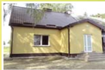
Świetlica wiejska w Nicku

Na terenie gminy są 24 sołectwa. Z roku na rok zmieniają się nasze wsie. Zmodernizowano świetlice w Kielpinach, Bełku, Klonowie, Jamielniku, Tarczynach, Nicku, Wąpiersku, Nowym Dworze, które są ośrodkami spotkań i integracji mieszkańców wsi.