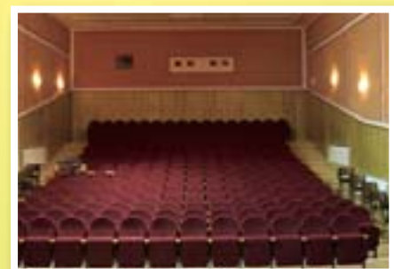
Sala widowiskowa w MGOK

Wśród planowanych przedsięwzięć inwestycyjnych wyróżnić należy przebudowę ulic: Kollątaja, ul. Granicznej od Jamielnika do ul. Zieluńskiej, Dębowej i następny etap budowy dróg w Wąpiersku, Jamielniku i Jeleniu, urządzenie placów zabaw w Jeleniu i Klonowie, kompleksową modernizację systemów grzewczych w obiektach użyteczności publicznej (orliki w Lidzbarsku i Dłutowie, Szkoła Podstawowa w Lidzbarsku, Dłutowie i Kielpinach, Gimnazjum w Lidzbarsku i Dłutowie, MOPS, Przedszkole w Lidzbarsku), termomodernizację budynków użyteczności publicznej (Szkoła Podstawowa w Lidzbarsku i w Dłutowie, Przedszkole w Lidzbarsku, Urząd Miasta i Gminy), dokumentacja na budowę świetlic w Zdrojku i Ciborzu.