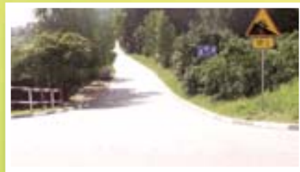
Droga na ul. Bukowej

Jeszcze w tym roku planowane jest rozpoczęcie realizacji budowy obwodnicy miasta, której elementem będzie most na ul. Chopina. Inwestycja ta poprawi bezpieczeństwo komunikacyjne w mieście. Na jej obrzeżach można będzie realizować inwestycje w zakresie potrzeb komunalnych, jak również inwestycji przemysłowych i usługowych.