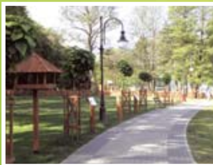
Promenada nad Jeziorem Lidzbarskim

Poprawiły się znacząco warunki dla szeroko rozumianej rekreacji. Powstały miejsca chętnie odwiedzane przez mieszkańców, miejsca rekreacji i wypoczynku. Dzieci i młodzież zyskały kolejne obiekty do uprawiania sportu.