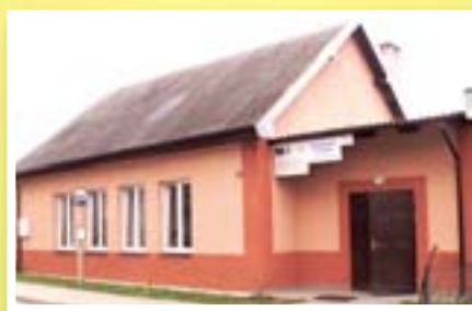
Świetlica wiejska w Nowym Dworze

Na wsiach powstały nowe wodociągi w miejscowościach Cibórz, Miłostajki, Słup, Chelsty, Bełk. Wykonano sieć kanalizacyjną w Chelstach. Wybudowano chodniki we Wlewsku, Nicku, Bełku, Dłutowie. W Chelstach, Jamielniku, Słupie i Wlewsku wybudowano zatoki i zainstalowano wiaty przystankowe.