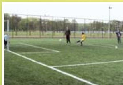
Orlik w Lidzbarsku

Urządzono place zabaw w miejscowościach Kielpiny, Dłutowo, Bryńsk. W ostatnich latach wykonano wiele remontów w szkołach gminnych. Przeprowadzono termomodernizację budynku Gimnazjum w Lidzbarsku, wymieniono okna w szkołach i wykonano remonty dachów.