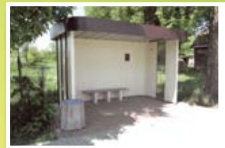
Przystanek we wsi Jamielnik

Zmodernizowano salę Ośrodka Kultury, jak również urządzono w siedzibie Ośrodka kolejne pomieszczenie z przeznaczeniem na prowadzenie świetlicy środowiskowej profilaktyczno-wychowawczej.